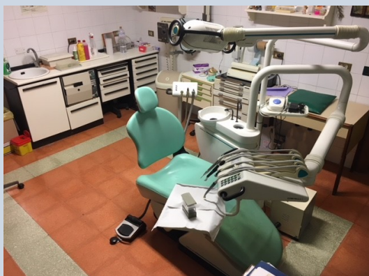
Studio odontoiatrico Missione Speranza e Carità

Missione di Speranza e Carità - Biagio Conte Via Archirafi, 31 - PALERMO